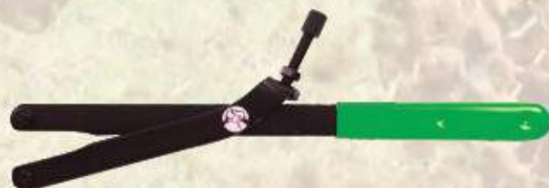
Przyrząd uniwersalny do blokady koła zamachowego MT010005