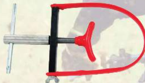
Uniwersalna blokada koła zamachowego MI010020