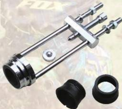
Przyrząd do demontażu łożysk dolnej półki ME020003