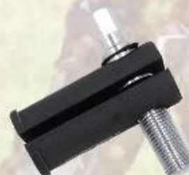
Przyrząd do demontażu łożysk z ramy ME020001