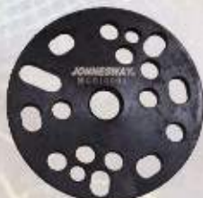
Ściągacz uniwersalny alternatora i kosza sprzęgłowego MG010001