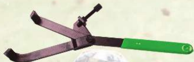
Przyrząd do blokady koła zamachowego MT010006