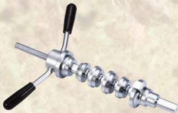
Przyrząd do montażu łożysk główki ramy ME020006