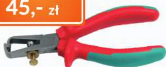
Szczypce do ściągania izolacji izolowane PV156