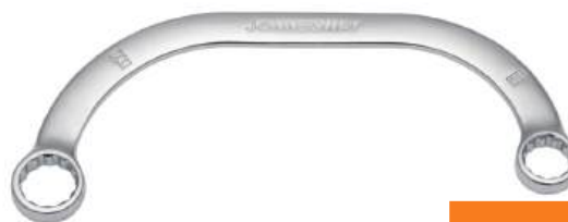
Klucz oczkowy do rozrusznika

Poprzednia najniższa cena: P2710: 75 zł, P2712: 119 zł, P2716: 188 zł